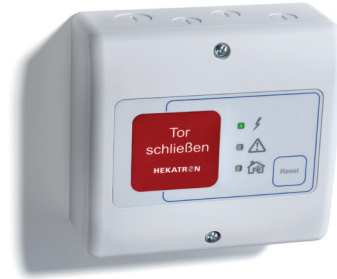
Abb. 1: FSZ Pro

Für eine Pufferung muss im FSZ Pro ein Energiespeichermodul ESM Pro verbaut werden. Das ESM Pro ist als Zubehör erhältlich.