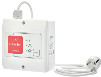
Abb. 3: FSZ Pro 230 V